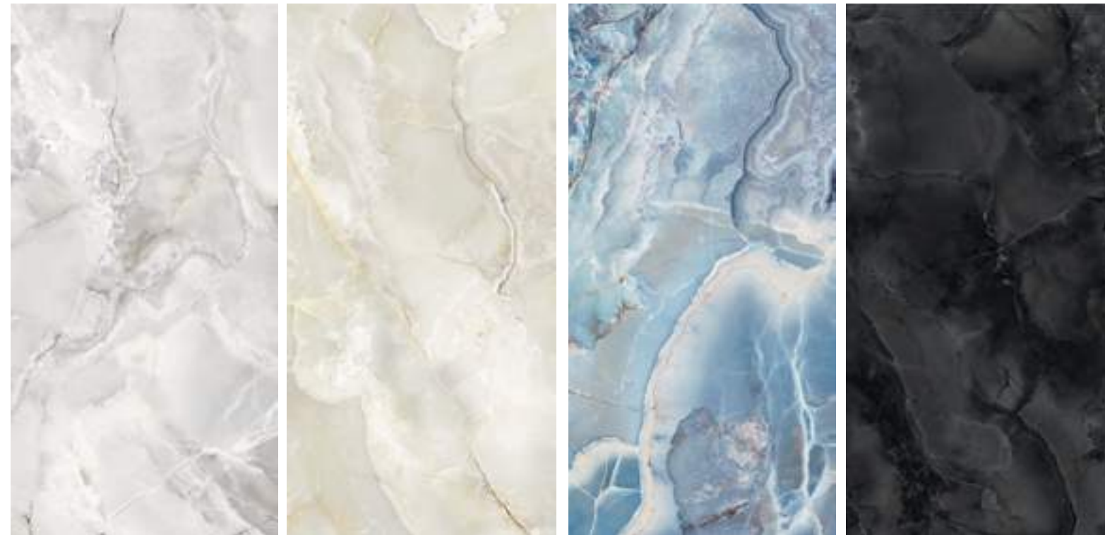
Riflessi bianco 60x120 L 28