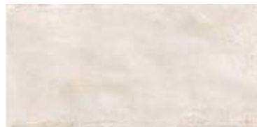
Nuance Beige 29,5 x 59,5" 228287 M61