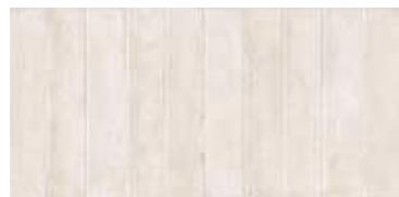
Nuance Beige Decor 29,5 x 59,5" 227763 M63