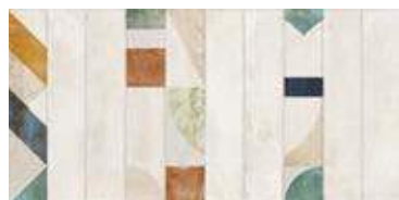
Nuance Delicate Beige 29,5 x 59,5" 228773 M64