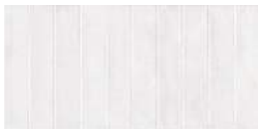
Nuance White Decor 29,5 x 59,5" 227764 M63