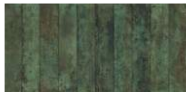
Nuance Green Decor 29,5 x 59,5" 227765 M63