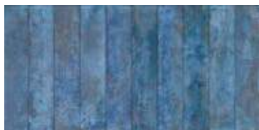
Nuance Blue Decor 29,5 x 59,5" 227762 M63