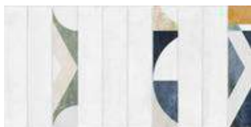
Nuance Delicate White 29,5 x 59,5" 228774 M64