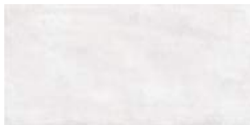
Nuance White 29,5 x 59,5" 227766 M61