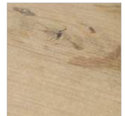
DRY | ANTIDESLIZANTE · SLIP RESISTANCE